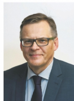
PREZES KASY ROLNICZEGO UBEZPIECZENIA SPOŁECZNEGO